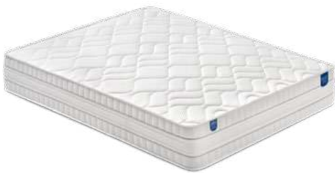
Royal 27 HR Aquapur® Firm