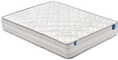
Suite 26 Muelle ensacado