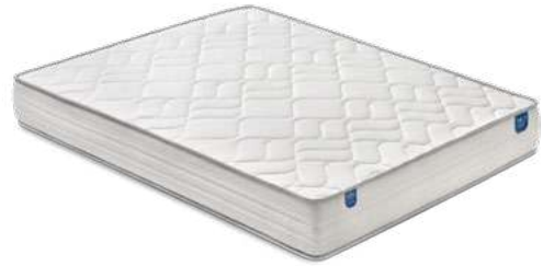
Suite 23 Muelle ensacado