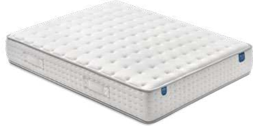
Suite 30 Muelle ensacado