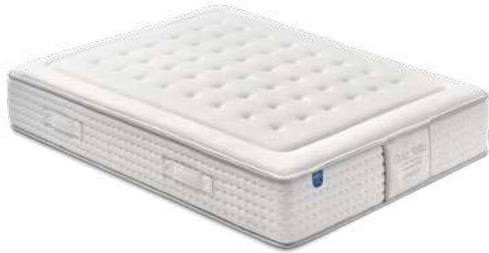
Gran Suite Muelle ensacado 7Z